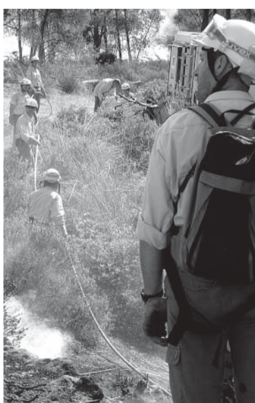
■ Löscharbeiten im Juli in Sa Trapa, Gemeinde Andratx.

Zurzeit wird auf den Balearn ein Verzeichnis von Siedlungen in der Nähe von Waldgebieten erstellt, die von Bränden gefährdet sein könnten. Auf dieser Basis sollen im Rahmen eines Pilotprojekts Sicherheits- und Notfallpläne